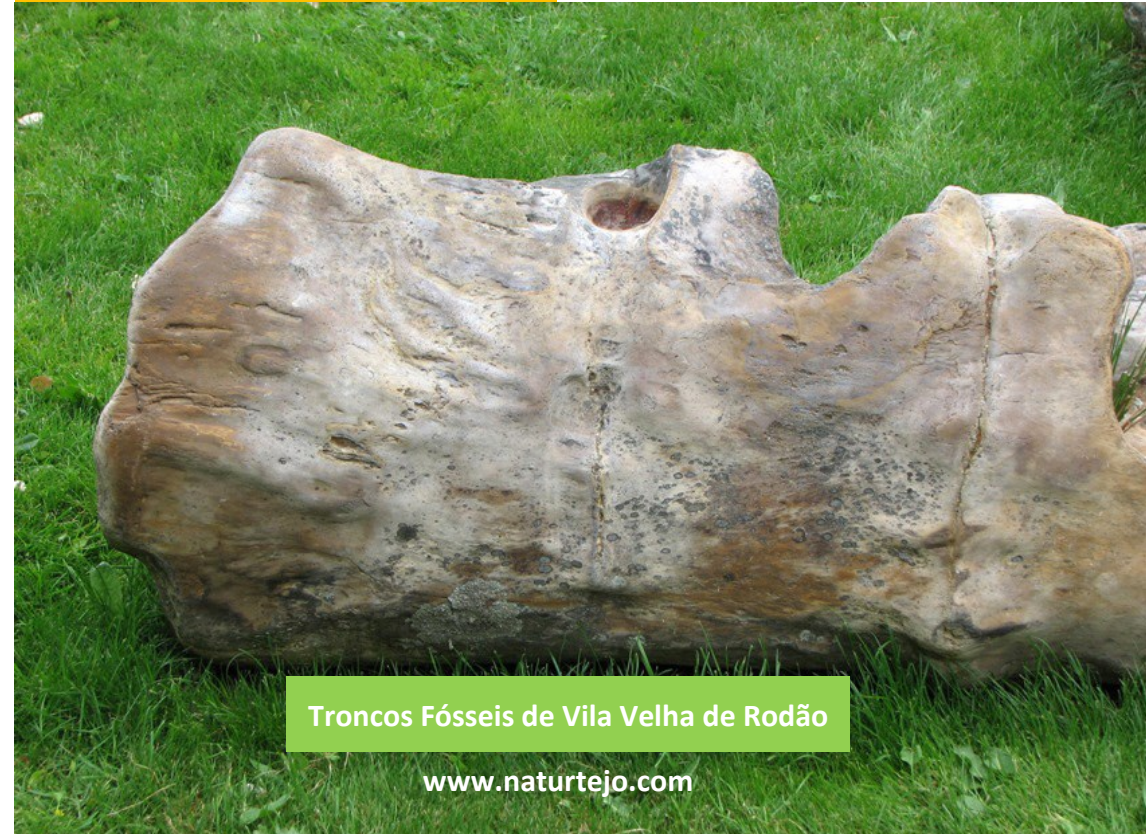
Troncos Fósseis de Vila Velha de Rodão